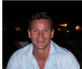
Gérant Lady Fitness Europe