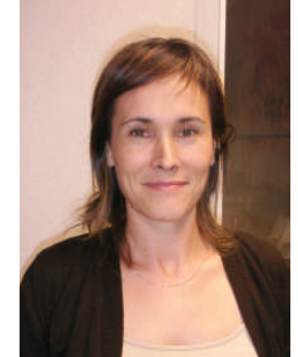
Resp. Site Internet