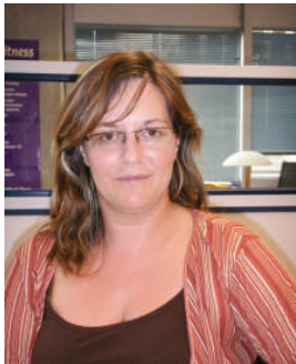
Assistante de Direction