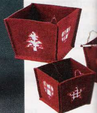
18 Patchwork Set de 3 corbeilles De 8 à 12 cm. Atla