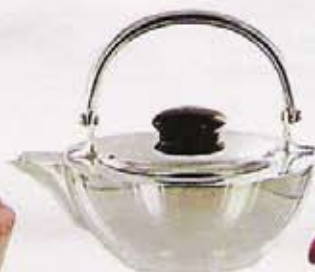
THÉIÈRE En métal argenté et ébène, 0,5 litre. Joska, 45 €.