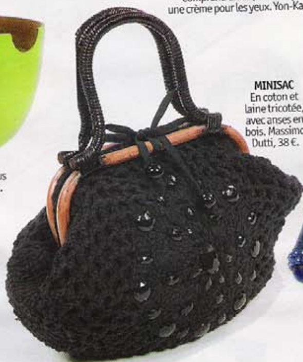
MINISAC En coton et laine tricotée, avec anses en bois. Massimo Dutti, 38 €.