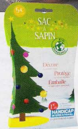
25 Sac à sapin solidaire Biodégradable. Gally, 5 € (1,30 € pour Handicap international).