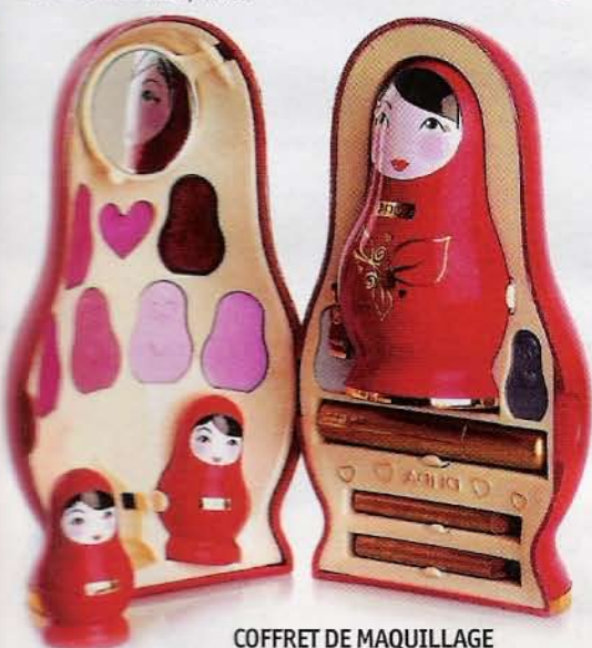
COFFRET DE MAQUILLAGE Tout le nécessaire dans trois poupées russes. Pupa, 50 €.