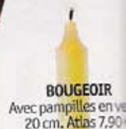
BOUGEOIR Avec pampilles en ve 20 cm. Atlas 7,90 €