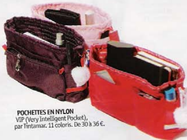
POCHETTES EN NYLON VIP (Very Intelligent Pocket), par Tintamar. 11 coloris. De 30 à 36 €.