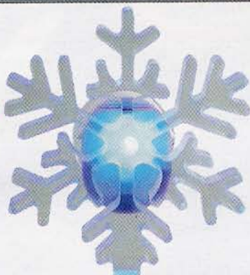
24 Flocon lumineux Fonctionne avec des piles, se fixe avec une ventouse. Gally, 4,50 €.