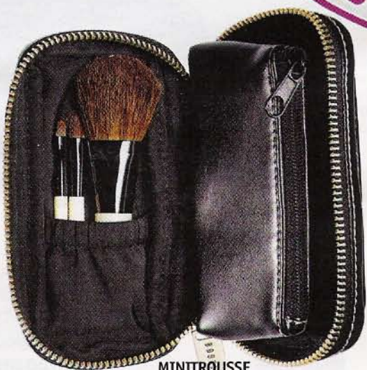
MINITROUSSE Avec trois pinceaux à maquillage. Bobbi Brown, 50 €.