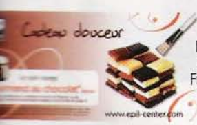
SOIN BEAUTÉ Bon valable dans tous les Esthetic Center de France. A partir de 19 €.