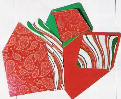
23 Pour le dire... Papier à lettres vintage. Clairefontaine, 3 € les 5.