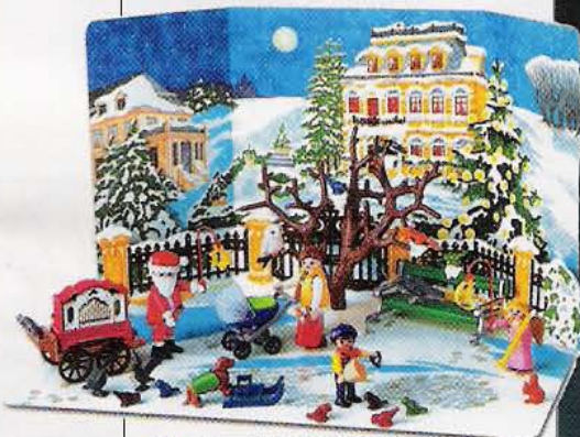
6 Calendrier de l'Avent Une figurine chaque jour du mois. «Jeux de Neige», Playmobil, 16 €.