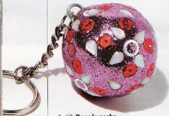
16 Dans la poche Porte-clés boule. Akara, 4,50 €.