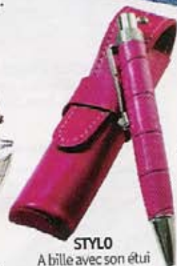
STYLO A bille avec son étui en cuir. Mignon, 34 €.