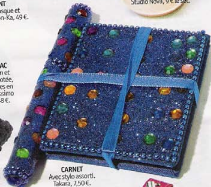
CARNET Avec stylo assorti. Takara, 7,50 €.