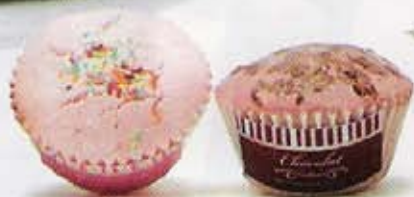
MUFFINS EFFERVESCENTS POUR LE BAIN Parfum quinauve ou chocolat. Nocibé, 3,30 € l'unité.