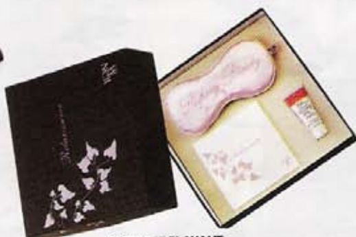
COFFRET RELAXANT Comprend un CD, un masque et une crème pour les yeux. Yon-Ka, 49 €.