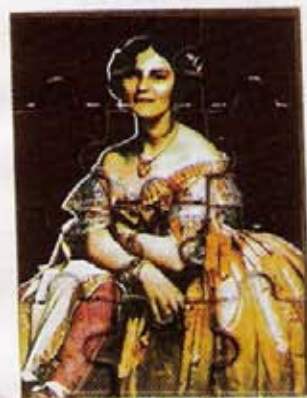
CHOCO-PUZZLE Carrés de chocolat noir sous forme de puzzle. VD-D, 15 €.