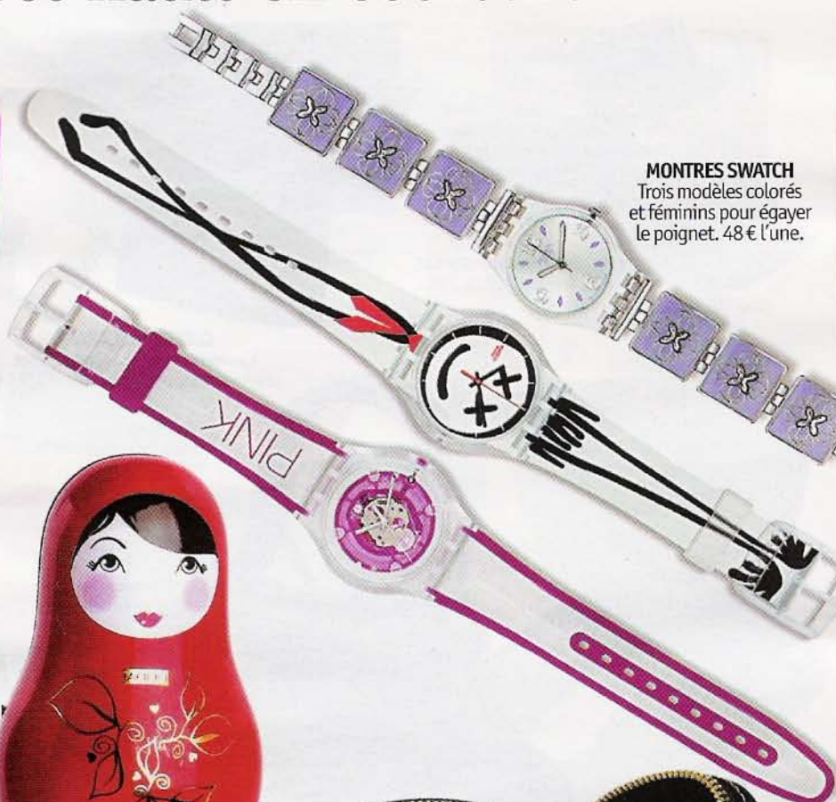
MONTRES SWATCH Trois modèles colorés et féminins pour égayer le poignet. 48 € l'une.