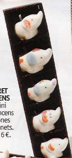
COFFRET D'ENCENS Six mini porte-encens avec cônes et bâtonnets. Takara, 6 €.