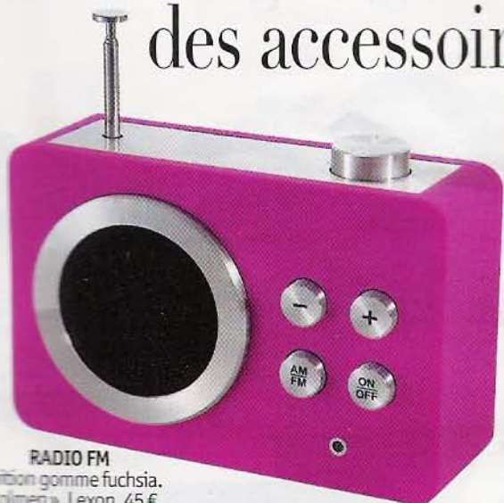
RADIO FM Finition gomme fuchsia. «Dolmen». Lexon, 45 €.