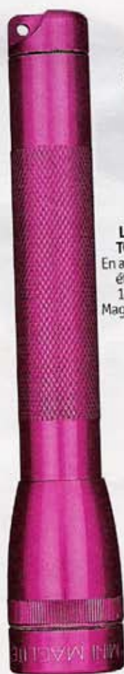
LAMPE TORCHE En alu brossé, étanche, 14,5 cm. MagLite, 29 €.