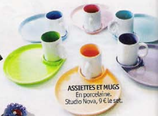
ASSIETTES ET MUGS En porcelaine. Studio Nova, 9 € le set.