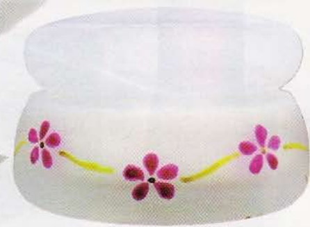
CRÈME HYDRATANTE Série personnalisée, pot peint à la main. Perlescence, 37 €.