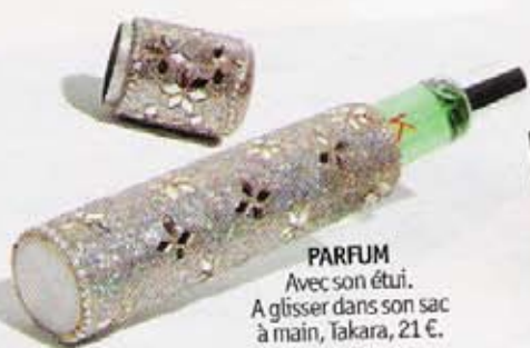
PARFUM Avec son étui. A glisser dans son sac à main, Takara, 21 €.