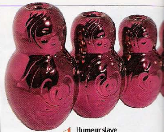
1 Humeur slave Vase composé de cinq poupées 9 à 30 cm. En céramique. Coming

Chaque année, pour les fêtes, votre intérieur se met sur son 31. Envie d'idées nouvelles? Voici une sélection d'objets étincelants et inattendus à faire graviter autour du sapin.