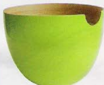
SALADIER En fibres de bambous laqués. Ekobo, 49 €.