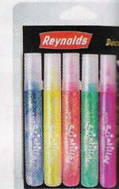
11 Et que ça brille! Stylos à encre colorés Reynolds, 3,75 € le