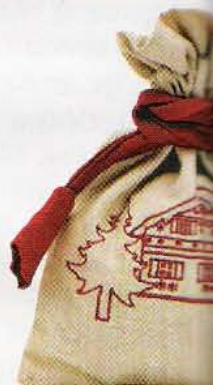
26 Pochette surp A garnir d'un ca En coton et lin.