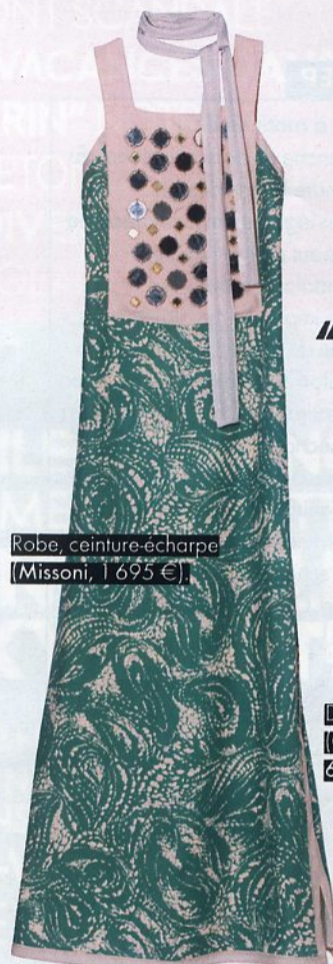
Robe, ceinture-écharpe (Missoni, 1 695 €)

Spartiates, robe longue et gilet brodé, adoptez le style 69, année hippie hot de ce film culte.