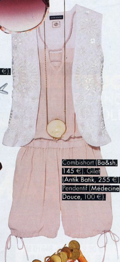
Combishort (Ba&sh, 145 €). Gilet (Antik Batik, 255 €). Pendentif (Médecine Douce, 100 €)