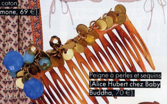
Peigne à perles et sequins (Alice Hubert chez Baby Buddha, 70 €)