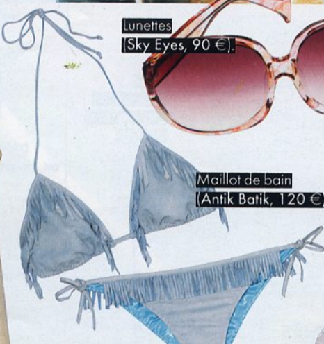
Lunettes (Sky Eyes, 90 €)