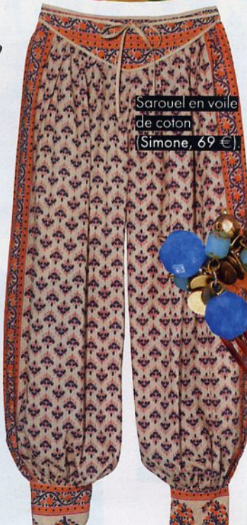
Sarouel en voile de coton (Simone, 69 €)