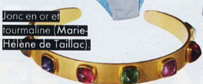
Jonc en or et tourmaline (Marie-Hélène de Taillac)