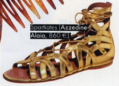
Spartiates (Azzedine Alaïa, 860 €)