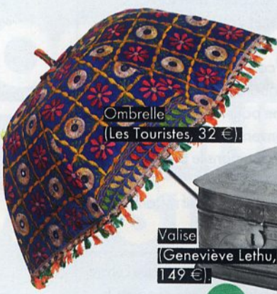
Ombrelle (Les Touristes, 32 €)