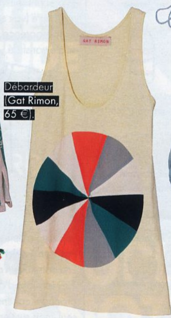
Debardeur (Gat Rimon, 65 €)