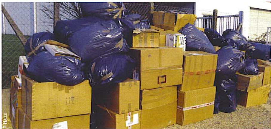
Proposé par l'association Environnement Industrie, la Bourse des déchets permet aux déchets des uns de devenir des matières premières pour les autres.

en matière de pollution, notre mission est aussi de faire valoir les actions qu'ils mènent dans le domaine de l'environnement", explique Marc Valentin. Deux outils pratiques sont proposés pour faciliter la gestion quotidienne des entreprises : la Bourse des déchets, "qui permet aux déchets des uns de devenir des matières premières pour les autres", et le guide du recyclage ( www.guide-recyclage-paca.com ),