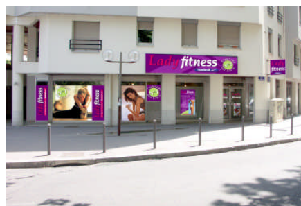
Lady Fitness – Part-Dieu