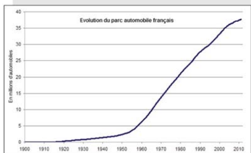
Evolution du parc automobile Français entre 1900 et 2010 (en millions)

Le marché de l'entretien et de la réparation automobile est l'un des seuls qui reste en constante CROISSANCE .