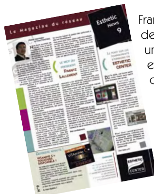
Journal trimestriel ESTHETIC NEWS

Une chaîne de télévision interne et des outils de vidéo-conférence sont en préparation afin de doter le réseau de moyens de communication et de promotions supplémentaires.