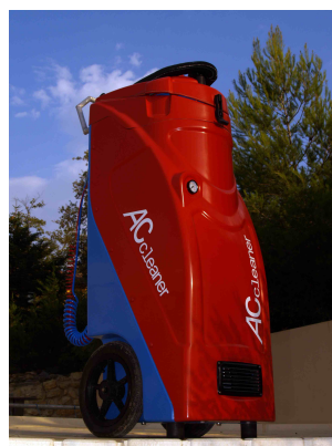
Une conception de la R&D ACcleaner

Une technicité exclusive qui permet de dire aujourd'hui que nettoyer un appareil d'air conditionné ne s'improvise pas. ACCLEANER garanti ses prestations pour que les systèmes restent propres, sains et sans surconsommation électrique.